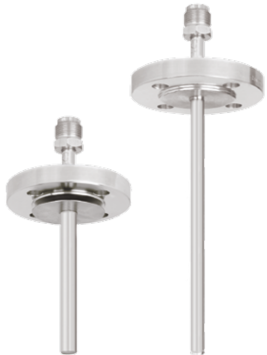
Rys. prawy: osłona termometryczna z przyłączem kołnierzowym model TW40-E

Ze względu na szeroki zakres zastosowania dostępne są różne warianty osłon termometrycznych. Rodzaj przyłącza procesowego oraz podstawowe metody wytwarzania są ważnymi kryteriami wyboru osłony termometrycznej. Możemy dokonać wyboru, między osłoną do wspawania a osłoną z przyłączem gwintowy lub kołnierzowym.