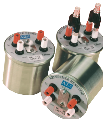
Resistor padrão modelo CER6000-RR com faixa de resistência diferente