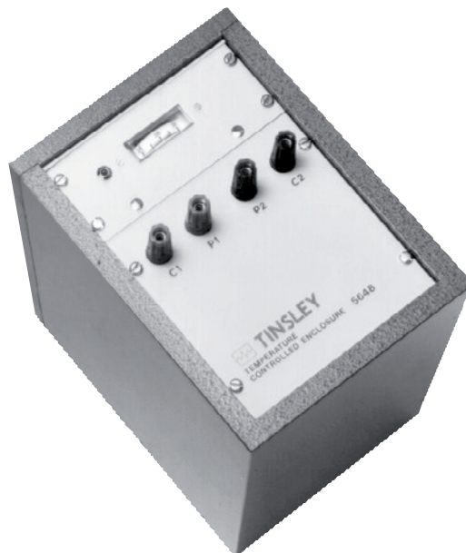
Invólucro térmico para resistores CER6000-RW, a uma temperatura fixa de 36 °C [97 °F]