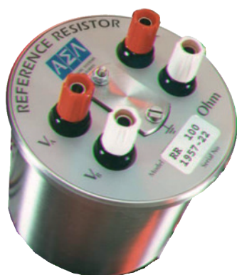
Resistor padrão modelo CER6000-RR com 100 \Omega