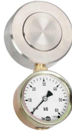
Гидравлический преобразователь силы сжатия, модель F1106

Измерение силы основано на гидравлическом принципе: сила, действующая на поршень, вызывает увеличение давления, которое регистрируется с помощью подключенного показывающего прибора. Шкала показывающего прибора может быть проградуирована в различных единицах измерения (например, Н, кН, кг, т).